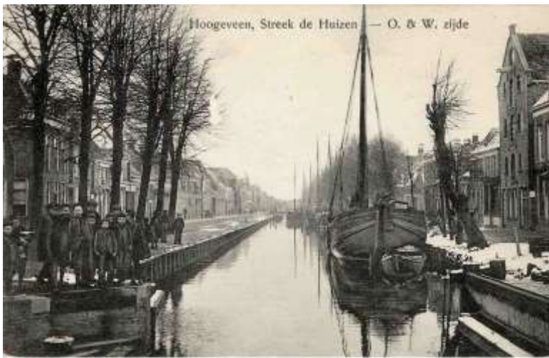
De Huizen Oost en West zijde Hoogeveen