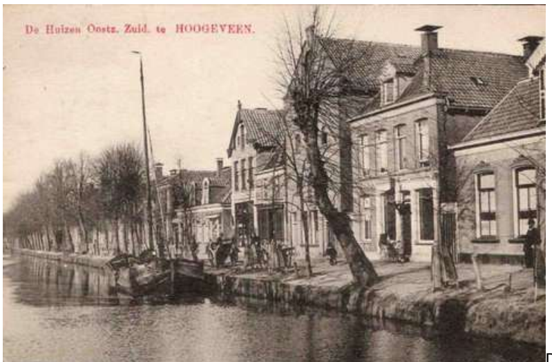
De huizen Oost Zijde Zuid Hoogeveen